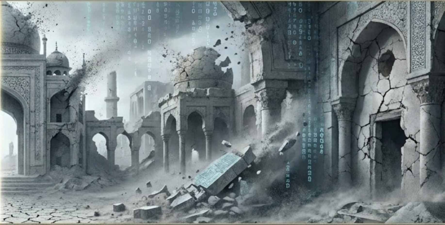
CURUZ (KUPKURU TOPRAK)

Maddeye ve güce tapmak Deccal sisteminin ağıdır.